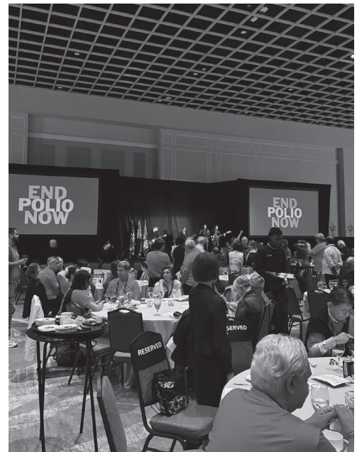
2026年1月11日から15日、フロリダ州オーランドで開催された国際協議会の様子